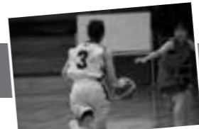
女子バスケットボール部 活動詳細はこちら

最後に「選手同士の仲の良さもこのチームの魅力。連帯感も活かして、必ず2部昇格を果たしたい」と話してくれた。学年の垣根を超えたチームワークを武器に勝利を求めた女子バスケットボール部の活躍が楽しみだ。同部は選手やマネージャーを募集しており、バスケットボールに興味がある方は見学や体験に足を運んで欲しい。