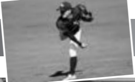
準硬式野球部 活動詳細はこちら

「練習風景を覗くと、大人の姿は見えず学生主体で声掛けや練習指導をしている姿が印象的であった。練習メニューも、大人の指導を受ける全国大会でも優勝したい」と熱い想いを語ってくれた。今年も準硬式野球から目が離せない。大学で野球を続けたいが、学業も私生活も両立させていきたいという方は一度見学に行ってみてはいかがだろうか?