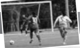
女子サッカー部 活動詳細はこちら

サッカーと向き合っている姿は、高い意識を感じられた。最後に「今年度のスローガンは『青天霹靂』としており、観ている人が驚いてもらえるようなプレーをしていき、今年こそは、インカレで優勝をしたい」と意気込みを話してくれた。また、今年度からマネージャーを募集し始めたようである。練習のサポートからSNSでの情報発信など選手を後押しできるポジションが新設されたとのことだ。最初は、サッカーを知らなくても、出来る仕事も多いとのことなので、興味のある方はぜひ見学に行ってみて欲しい。