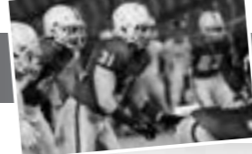
アメリカンフットボール部 活動詳細はこちら

「準備のスポーツ」と言われるくらい、分析と対策が非常に重要である。全てを出し切り1部BIG8の舞台で戦っていきたい」と意気込みを話してくれた。最後に「1部BIG8で上位に食い込めるチームにしたい。その上で1部TOP8を目指していく。意識を高く持ち、オンとオフがしっかりと活動が徹底していきたく」と熱く語ってくれた。同部は、マネージャー以外にも選手を募集しているように、未経験者でも活躍している選手もいるという。ぜひ体験に行ってみてはいかがだろうか?