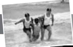
ライフセービング部 活動詳細はこちら

多く、水泳未経験者でも始められる。また、夏場はライフセーバーとして活躍出来る為、夏休みも充実して過ごせる」と話す。他大学のライフセーバーとも交流が多いように、大学生活を充実させた方がいい方はおすすめです。最後に「今年度は、インカレで入賞できる選手を増やしていきたい。参加できる競技数を多くするためにも新入部員の力が必要なので、ぜひ見学しに来てほしい」と熱い想いを語ってくれた。今年もインカレで活躍する姿が楽しみだ。