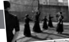
弓道部 活動詳細はこちら

毎年の新入部員について「大学で弓道をするには、経験者でないといけないと思われがちが多いと思うが、当部は未経験者も多く入部しているので安心して欲しい」と話してくれた。未経験者には、弓道の基本である「射法八節」を先輩が指導してくれるとのことだ。最後に「今年度は、男子団体・女子団体ともに1部昇格を果たすための活動をしていきたい。また、弓道は生涯武道であり将来に必ず役に立つと思う。少しでも興味があればぜひ練習を見学しに来て欲しい」と想いを語ってくれた。弓道部の更なる躍進に今年も期待したい。