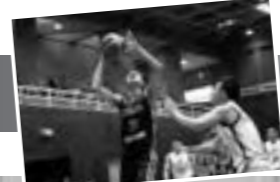
男子バスケットボール部 活動詳細はこちら

識高く活動しているのも特徴だ。最後に「リーグ戦1部で優勝を勝ち取りたい。また、その先に控える第76回全日本大学バスケットボール選手権大会も優勝し日本一になりたい」と熱い想いを語ってくれた。男子バスケットボール部の活躍に今後も期待したい。また同部は、学生スタッフを募集しているように、チームを支えたいという方はぜひ見学に行ってください。