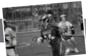
男子ラグビー部 活動詳細はこちら

2023年7月9日(日)～12月17日(日)に開催された第35回関東学生ラグビーフットボール選手権大会(以下、リーグ戦)にて、白熱した試合展開を見せるも一歩届かず、3部降格となった男子ラグビー部S.E.A.G.U.L.S.。2部リーグへ返り咲くために新チームが活動した。