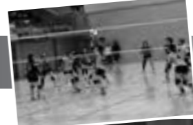
女子バレーボール部 活動詳細はこちら

あった。続けて「私を含む4年生は、今までに培ってきたことを全て出し切る年となった。後輩を導き、総力戦で試合に臨んでいく」と意気込みを語ってくれた。最後に「今年こそ2部の人替戦に出場し、1部昇格を果たしたい。日頃から応援してくれる卒業生やサポーターの方の為に結果を残したい」と抱負を話してくれた。その夢が叶うよう躍進を期待したい。なお、同部はマネージャーを常に募集しているように、夢を応援したい方はぜひ見学に行ってください。