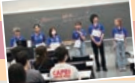
オープンキャンパス企画部 活動詳細はこちら

春と夏に行われるオープンキャンパスで、高校生たちに神奈川大学の魅力を伝えるためのイベントを日々企画しているオープンキャンパス企画部。同サークルは「学生主体」でイベントを創り上げており、オープンキャンパス毎に大きなやりがいを得られているという。