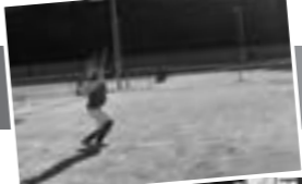
硬式テニス部 活動詳細はこちら

生活でも礼儀や礼節を意識した活動をしており、日ごろから精神面の安定を図っているとのことだ。最後に「今年度は、目標としているリーグ戦7部での優勝と6部昇格を果たしたい。ひたむきにテニスと向き合い、勝利を積み重ねていきたい」と熱い想いを話してくれた。今年度が飛躍の年となることを期待したい。また同部は、未経験者から始める選手も多いとのことなので、興味がある方はぜひ見学や体験に足を運んで欲しい。